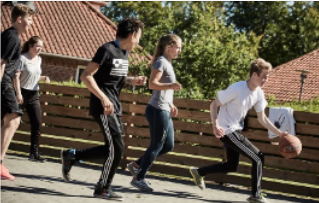
Idræt fylder meget på NE, lige som kreative fag, musik og teater