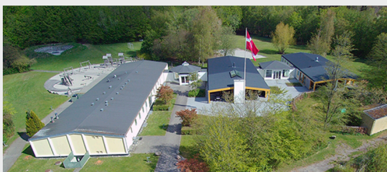
Klar til Birkedal