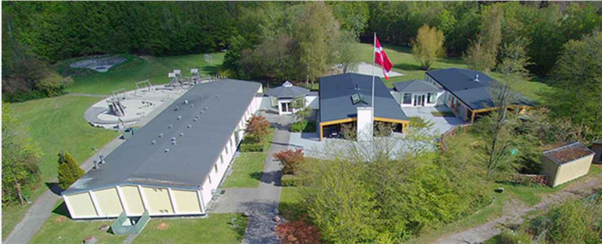
Birkedal set fra oven